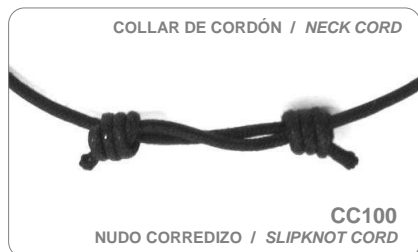
COLLAR DE CORDÓN / NECK CORD