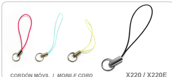
CORDÓN MÓVIL / MOBILE CORD