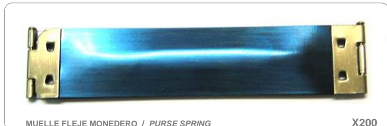
MUELLE FLEJE MONEDERO / PURSE SPRING