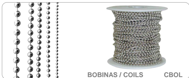
BOBINAS / COILS CBOL