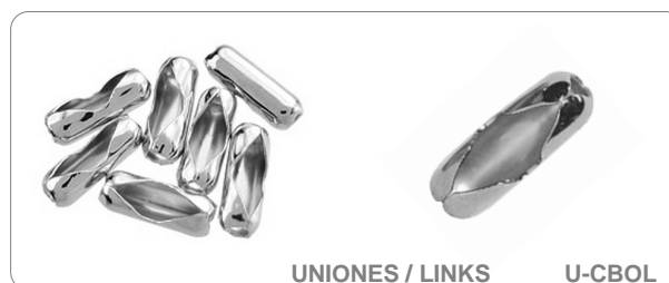
UNIONES / LINKS U-CBOL